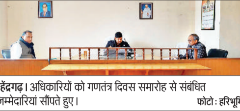
महेन्द्रगढ़। अधिकारियों को गणतंत्र दिवस समारोह से संबंधित जिम्मेदारियां सौंपते हुए।