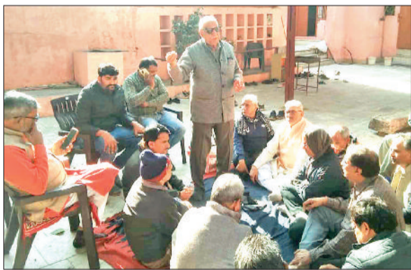
महेन्द्रगढ़। देवी जी के मंदिर में बैठक करते हुए।