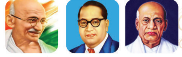
महात्मा गांधी डॉ. भीमराव अम्बेडकर सरदार वल्लभभाई पटेल