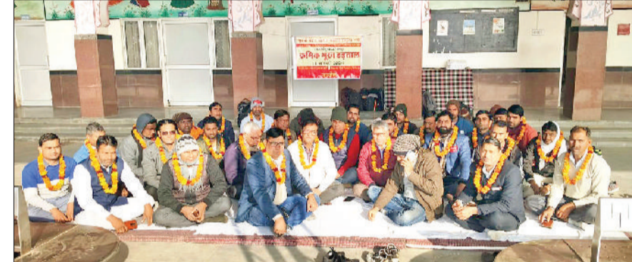
नारनौल। रेलवे स्टेशन पर भूख हड़ताल कर धरने पर बैठे रेलवे अधिकारी एवं कर्मचारियों।

पुरानी पेंशन बहाली की मांग को लेकर वीरवार को नारनौल के रेलवे स्टेशन पर एनडब्ल्यूआरईयू व यूपीआरएमएस दोनों के संयुक्त मोर्चे ने पुरानी पेंशन को लेकर रिले हंगर स्ट्राइक कर प्रदर्शन किया। इस दौरान आंदोलनकारियों ने स्टेशन से गुजरती रेलों के सम्मुख प्रदर्शन किया और नारेबाजी करते हुए केंद्र सरकार से पुरानी पेंशन बहाल करने की मांग की। इस धरना-प्रदर्शन में नारनौल रेलवे स्टेशन ही नहीं, खोरी से माउंड तक के स्टेशनों के रेलवे कर्मचारियों एवं अधिकारियों ने नारनौल स्टेशन पर आकर धरने में भाग लिया।