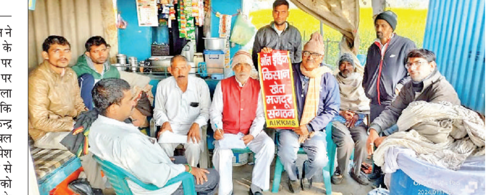
नारनौल। हस्ताक्षर अभियान चलाते संगठन के सदस्य।

है, जिससे खेती में लागत बढ़ जाती है, प्राकृतिक आपदा आने से फसलें बर्बाद हो जाती है, मुआवजा नहीं मिलता तथा फसल के समय पर भाव पिट जाते हैं, पूरे दाम नहीं मिलते। इन कारणों से किसान कर्ज के जाल में फंस जाते हैं और आत्महत्या तक करने को मजबूर होते हैं। केंद्र व राज्य सरकारों