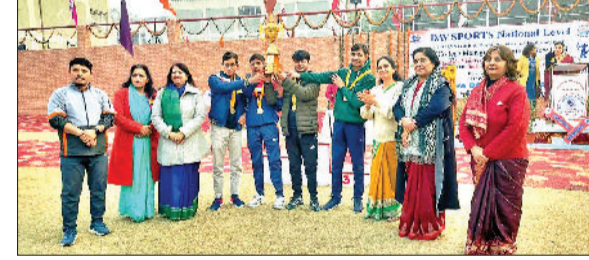
नारनौल। डीएवी स्कूल के विजेता विद्यार्थी व स्कूल स्टॉफ।