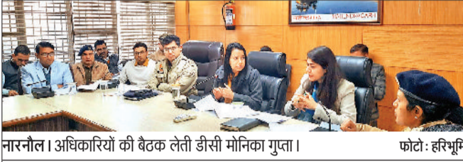
नारनौल। अधिकारियों की बैठक लेती डीसी मोनिका गुप्ता।

आईटीआई मैदान में 26 जनवरी को मनाए जाने वाले जिला स्तरीय गणतंत्र दिवस समारोह की तैयारियों के संबंध में उपायुक्त उपायुक्त मोनिका गुप्ता ने वीरवार को लघु सचिवालय में अधिकारियों की बैठक ली। इस अवसर पर उन्होंने अधिकारियों को इस समारोह की जिम्मेदारियां तय की। डीसी ने निर्देश दिए कि समारोह में शामिल टुकड़ियों की रिहर्सल करवाई जाए। इस रिहर्सल पर विशेष फोकस दें। इसके बाद अंतिम रिहर्सल 24 जनवरी को होगी। रिहर्सल के समय भी एंबुलंस व डाक्टर तथा बच्चों के लिए पेयजल की व्यवस्था होनी चाहिए। उपायुक्त ने कहा कि सांस्कृतिक कार्यक्रमों के संबंध में उन्होंने निर्देश दिए कि एक कार्यक्रम पांच मिनट से अधिक नहीं होना चाहिए। इसके लिए भी लगातार रिहर्सल करवाएं। इससे पहले कमेटी समय से पहले सांस्कृतिक टीमों का चयन कर लें। गाने के बोल पहले चेक करें। झांकियों के संबंध में उन्होंने विभिन्न विभागों के अधिकारियों