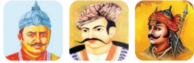
राजा नाहर सिंह राजा राव तुलाराम महाराणा प्रताप