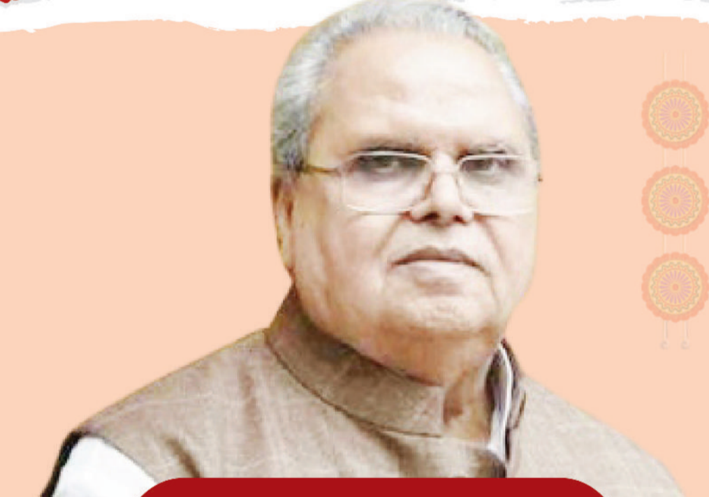
मुख्यातिथि माननीय श्री सत्य पाल सिंह मलिक प्रसिद्ध भारतीय राजनीतिज्ञ एवं पूर्व राज्यपाल- जम्मू कश्मीर, गोवा, बिहार एवं मेघालय