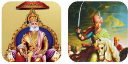
महाराज अग्रसेन रानी लक्ष्मीबाई