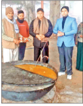
महेन्द्रगढ़। गावों के लिए चाट बनाते हुए।