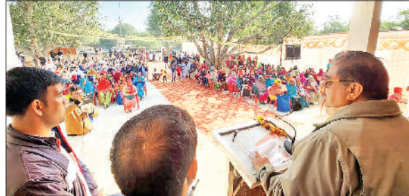
नारनौल। जनसभा को संबोधित करते पार्टी अध्यक्ष डा. अजयसिंह चौटाला।

जननायक जनता पार्टी के राष्ट्रीय अध्यक्ष डा. अजय सिंह चौटाला ने अपने दो दिवसीय दौरे की शुरुआत वीरवार गांव बलाहा खुद से की। इसके बाद गांव दौंचाना, नौलाजा, बिहारीपुर, खातोली जाट व गांव नंगली में ग्रामीण जनसभा को संबोधित किया। इस दौरान जनसभा