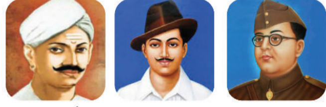
मंगलपाण्डे शहीद भगत सिंह सुभाष चन्द्र बोस